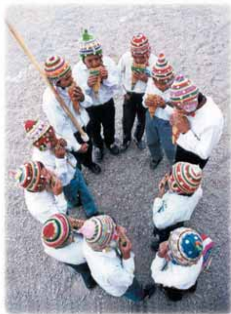
Taller de sikus

El Tantanakuy es una reunión, un encuentro de unos con otros por la música, la danza y la poesía.