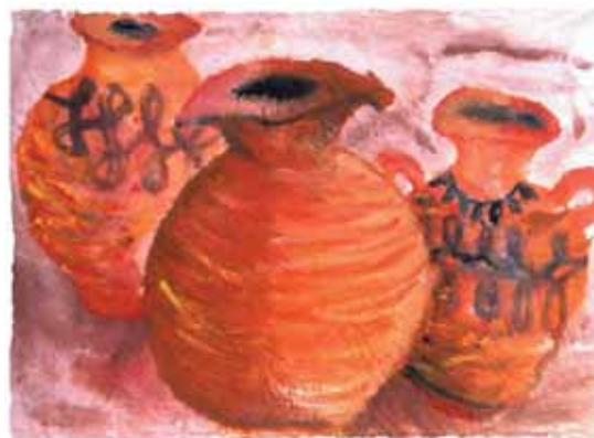
SOLEDAD ALBORNOS - 14 años

Esta institución ha sido beneficiada por los proyectos: "Cine Nómada" (Sorpresa y 1/2 de Canal 13); Proyecto "Fortaleciendo la identidad" (Gobierno de Canadá); Proyecto "Ayni", creación de un albergue para jóvenes, (Fundación Arcor).