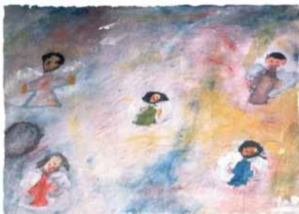
NADIA CRUZ - 8 años

El 1° de Noviembre los difuntos regresan a visitar las casas donde vivieron. Ese día se prepara su comida favorita.