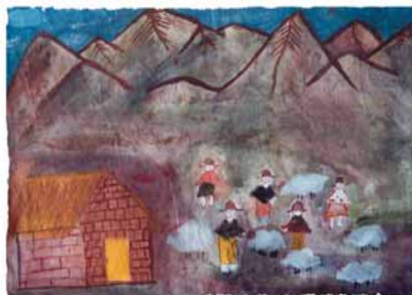
SILVIA PUCA - 13 años