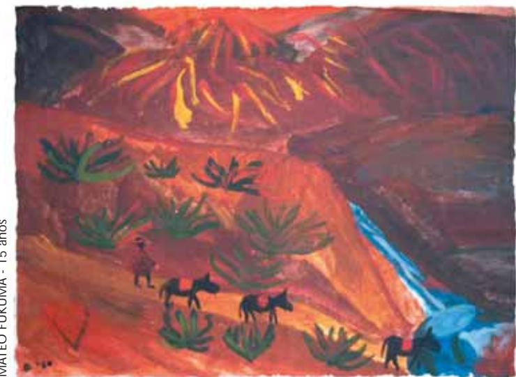
MATEO FUKUMA - 15 años

En el aire flota perfume de palabras que se mezcla con coplas que bailan desfachatadas entre las faldas de las mujeres, les sacan los sombreros y les desatan las trenzas.