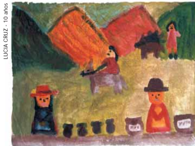
LUCIA CRUZ - 10 años