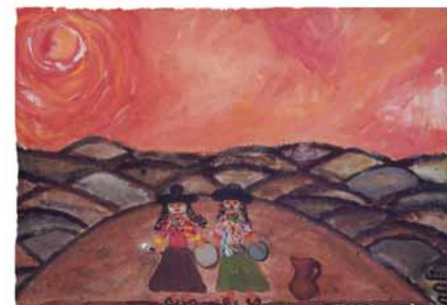
LORENA MAIZARES - 13 años