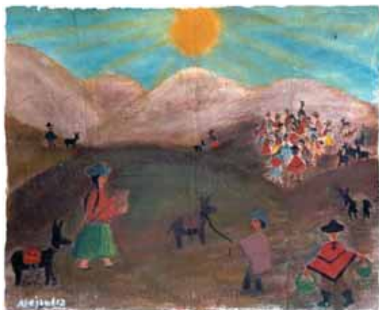
LORENA MAIZARES - 14 años