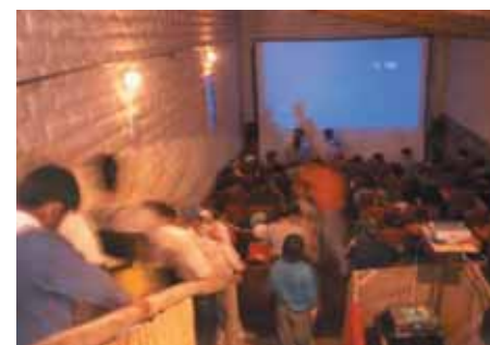
Sala de cine "Jorge Prelorán"

Estos encuentros tienen sus raíces en el Tantanakuy de adultos que comenzaron en 1975 celebrándose todos los años antes del carnaval, donde participaban, en igualdad de condiciones, tanto figuras consagradas como artistas anónimos. Fue la primera iniciativa de este tipo, no competitiva, a partir de asistencias totalmente gratuitas por parte de todos los artistas, y con claros objetivos de promoción cultural que se celebró en la Argentina.